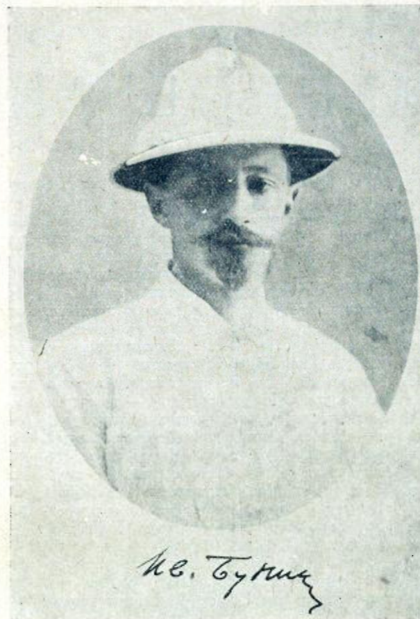
И. А. Бунинъ вь молодые годы.

Она протяжно и грустно любовалась, какъ течеть по долинѣ казачье войско, какъ вьдетъ его славный Дорошенко, ѣдетъ впереди всѣхъ. А за нимъ, говорила она, за нимъ Сагайдачный. —