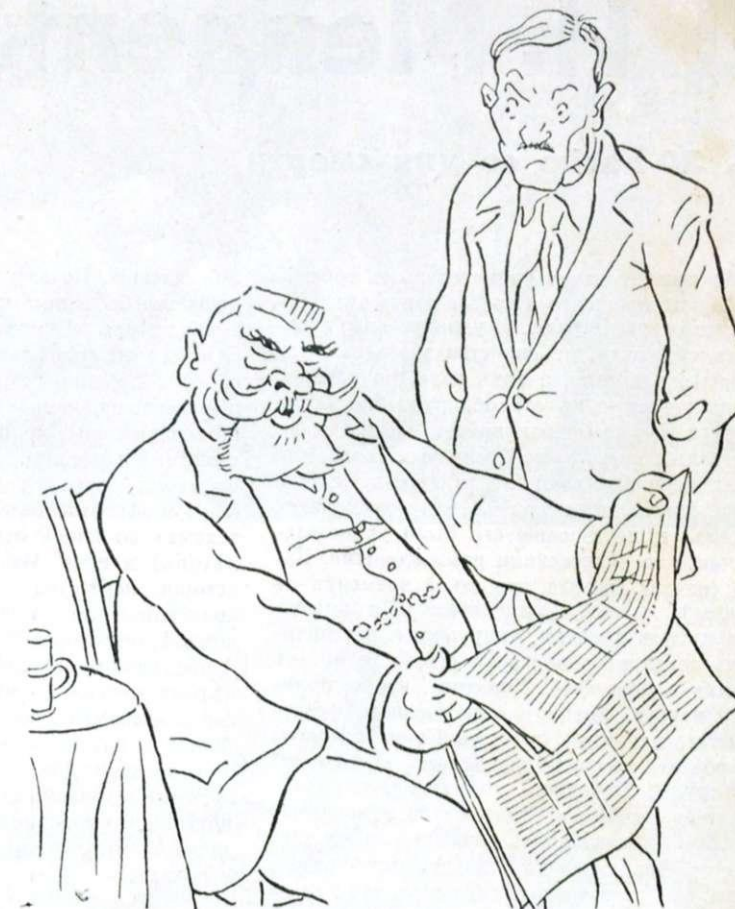
— Ага! Правильно говорить Троцкій!..