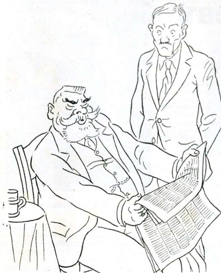
— Такъ, такъ... Очень хорошо дѣлаетъ Сталинъ!..