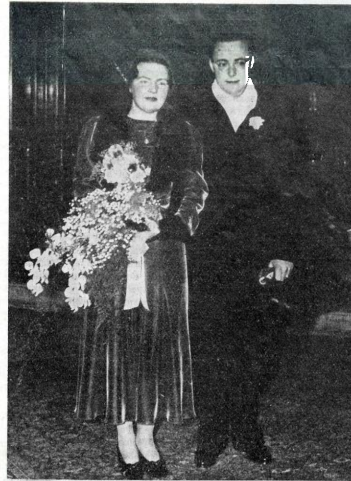
ПОМОЛВКА НАСЛѢДНОЙ ПРИНЦЕССЫ ГОЛЛАНДСКОЙ Наслѣдная принцесса нидерландская Юліана съ своимъ женихомъ, прицемъ Бернгардомъ фонъ - Липпе - Бистерфельдомъ, послѣ посвященія гаагской городской думы, въ которой они объявили о своей предстоящей свадьбѣ.