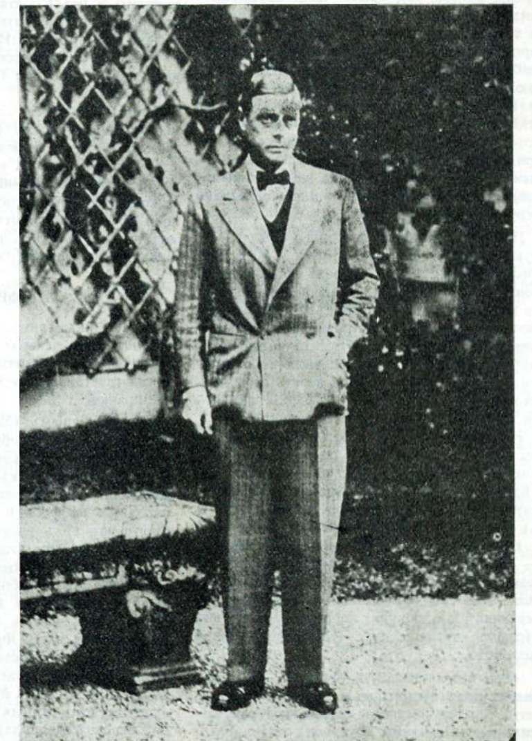
ПЕРВАЯ ФОТОГРАФІЯ ГЕРЦОГА ВИНДЗОРСКАГО Фоторепортеры, осаждавшіе замокъ бар. Ротшильда въ Тиролѣ, въ которомъ нашель приотъ б. англійскій король, дали обѣщаніе оставить его въ покоѣ, если онъ дастъ себя разъ сфотографировать. Результатомъ этого «джентльменскаго соглашения» явилась эта первая фотографія герцога Виндзорскаго.

ЕЖЕДНЕВНО ОТЪ 4 ЧАС. ДО 2 ЧАС. НОЧИ ПРАДО 41, av. WAGRAM. Tél.: Gal. 60-38 Дирекція: А. А. СКРЯБИНЪ.