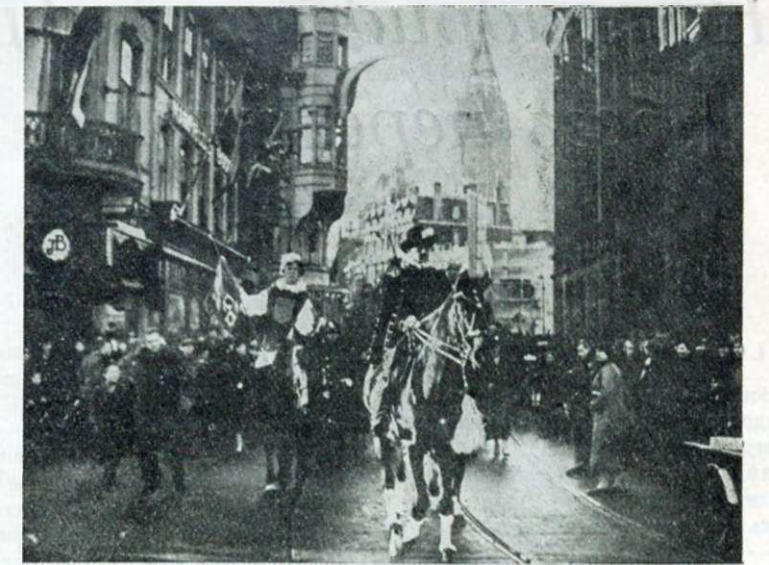
ГЕРОЛЬДЫ НА УЛИЦАХЪ ГААГИ Герольды въ средневѣковыхъ костюмахъ объявляютъ населенію о помолвкѣ наслѣдной принцессы Юліаны.