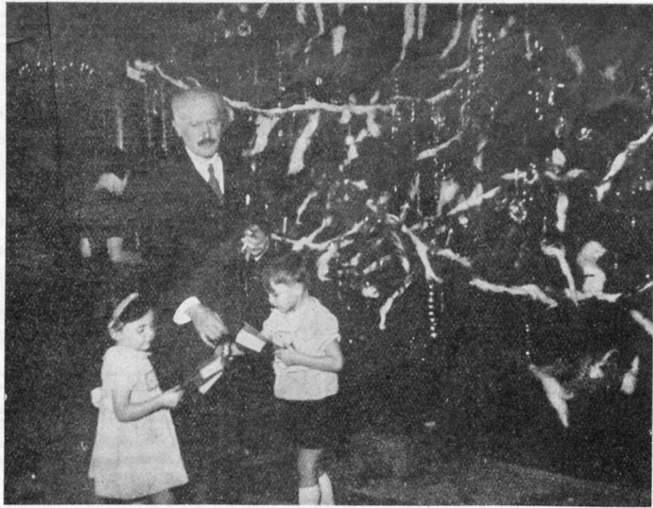
ЕЛКА У ПРЕЗИДЕНТА А. ЛЕБРЭНА

Къ числу прїятныхъ обязанностей главы французской республики принадлежатъ рождественскїя елки, устраиваемыя въ эти дни въ Елисейскомъ дворцѣ для дѣтей Парижа. На нашемъ снимкѣ президентъ А. Лебрэнъ раздаетъ своимъ маленькимъ гостямъ подарки.