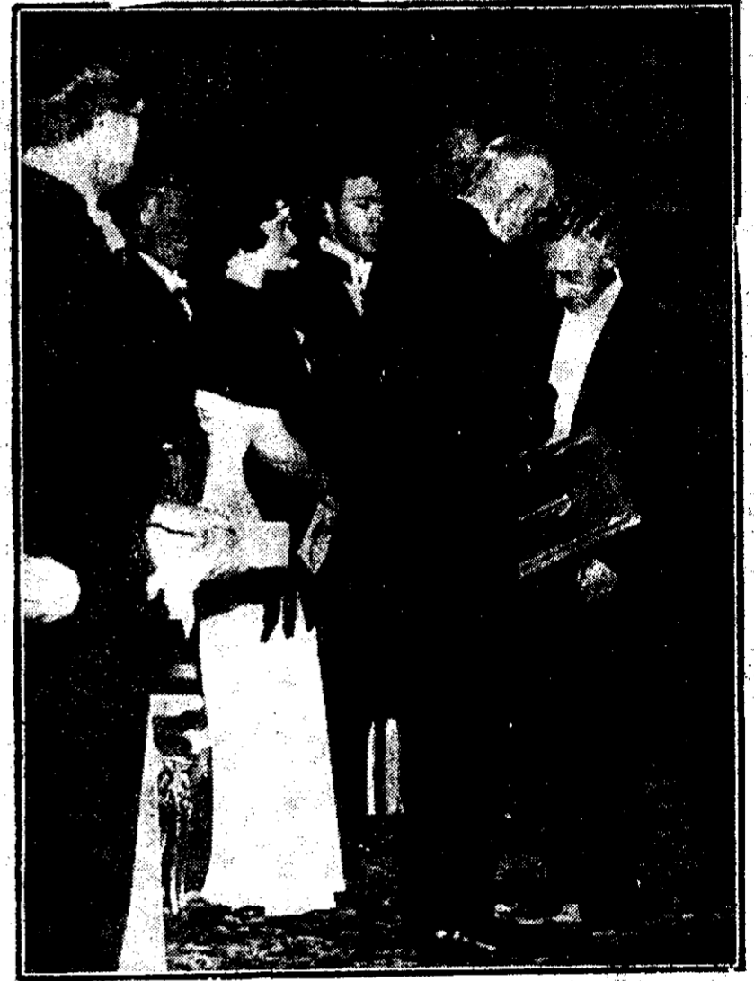
Король шведскій Густавъ V вручаетъ И.А. Бунину премію Нобеля.

Стокгольмъ, (отъ собственнаго корреспондента).