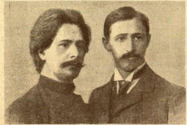
И. А. Бунинъ и Леонидъ Андреевъ.

Въ молодые годы И. А. Бунинъ получилъ широкую извѣстность, благодаря своимъ мастерскимъ переводамъ иностранныхъ поэтовъ. Широко образованный, просвѣщенный русскій интеллигенціи, которая знала иностранные языки такъ же хорошо, какъ и свой родной языкъ, Бунинъ съ легкостью и блескомъ перевелъ рядъ классическихъ произведеній міровой литературы. То была