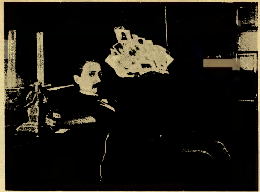
И. А. Бунинъ у себя дома въ девятисотыхъ годахъ.

пора широкаго и основательнаго ознакомленія нашего читателя съ иностранными поэтами: Бальмонтъ переводилъ Гаупмана и Эдгара По, Гумилевъ — Теофила Готье и Бодлера, И. А. Бунинъ — перевелъ «Пѣснь о Гайватѣ» Лонгфелло и удостоился за этотъ образцовый переводъ Пушкинскіе премии.