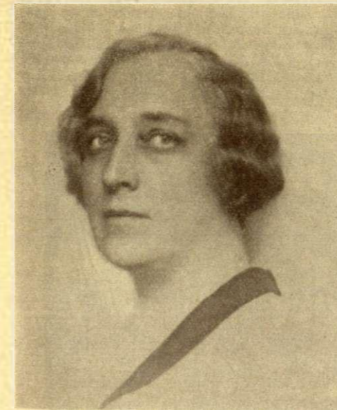
В. Н. Бунина, рожденная Муромцева.