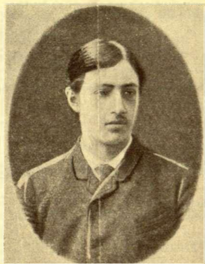
И. А. Бунинъ въ молодые годы.

Возраженіе несправедливое, теперь блестяще опровергнутое. Шведы вообще очень независимый народъ, это доказываетъ всей ихъ исторіей. Совсѣмъ недавно попытка одной иностранной державы повліять на шведскую печать встрѣтила самый рѣшительный отпоръ со стороны всѣхъ газетъ Швеціи, отъ социалистическихъ до консервативныхъ. Стокгольмскіе академики не зависятъ отъ собственнаго правительства; почему же они станутъ считаться съ правительствомъ?