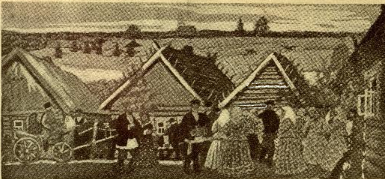
Б. М. Кустодіевъ.