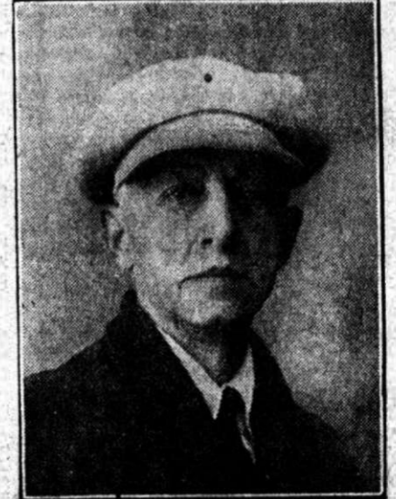
И. А. Бунинъ.

За рубежомъ И. А. Бунинъ продолжалъ свою литературную дѣятельность, издавая новыхъ книгъ, изъ которыхъ наибольшій извѣстностью пользуются «Митина Любовь» и «Жизнь Арсеньева». И. А. Бунинъ является непримиримымъ и послѣдовательнымъ противникомъ смертельнаго яда большевизма. Въ его воспоминаніяхъ, въ его нѣкоторыхъ стихахъ, это проявляется съ величайшей отчетливостью. Въ свое время произвелъ огромное впечатлѣніе выступленіе И. А. Бунина съ рѣчью въ собраніи, въ которомъ участвовали и другіе видные представители русской литературы, со страстной проповѣдью непримиримости въ борьбѣ съ этимъ зломъ.