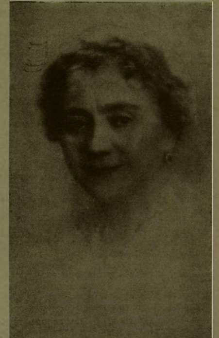
Профессоръ пѣнія Т. Ф. ЛЕШЕТИЦКАЯ. (Къ 35-ти лѣтнему юбилею, педагогической дѣятельности).

— Женщина способна на все на свѣтѣ; мужчина на остальное.