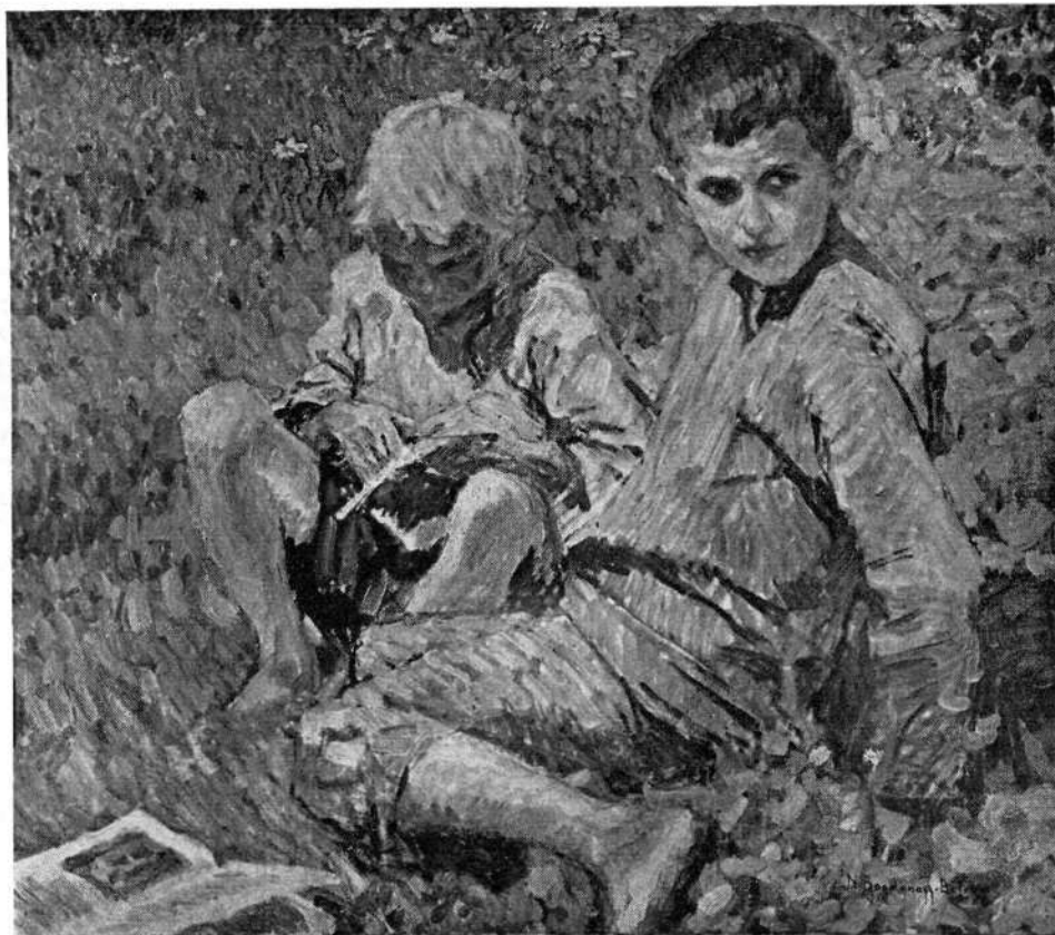
Н. П. Богдановъ-Бѣльскій.

Любуюсь; для видимости интереса, вниманія и безпристрастности выдумываю маленькія придирки, пересыпая ихъ лестью. Она наливаетъ чай, — „вѣдь вамъ покрѣпче, неправда-ли?“ — и съ улыбкой подаетъ мнѣ чашку, манерно отставивъ мизинецъ. И начинается бесѣда, если только это можно на-