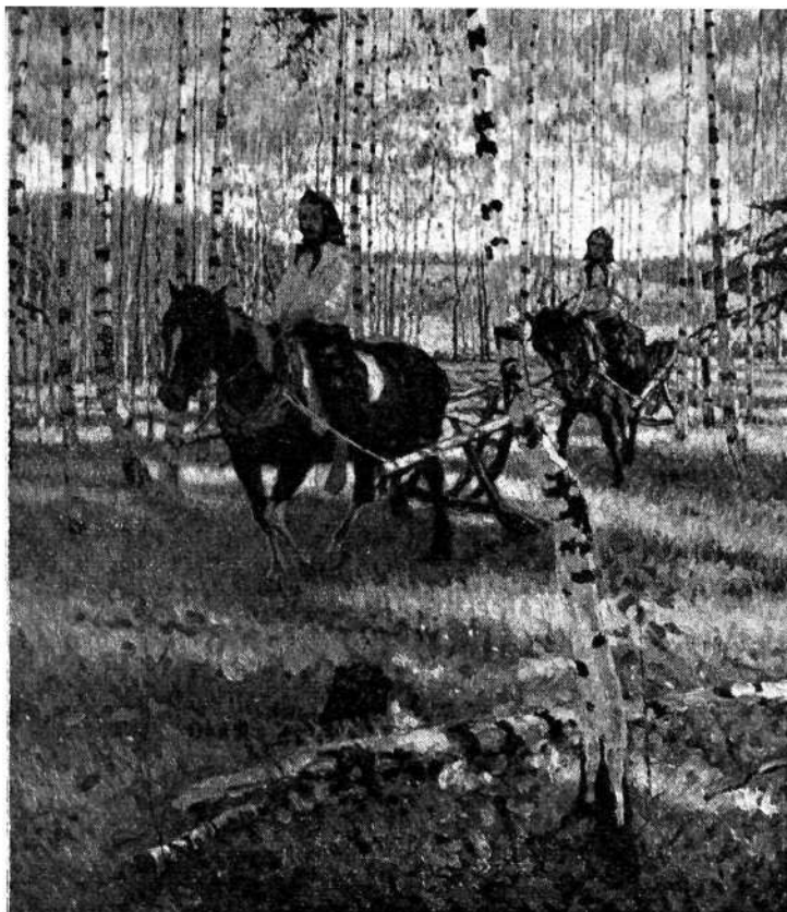
Н. П. Богдановъ-Бѣльскій.

Бросивъ сарафанъ на піанино, она опять садится на кресло рядомъ со мной и, не спуская ея меня расширенныхъ глазъ,