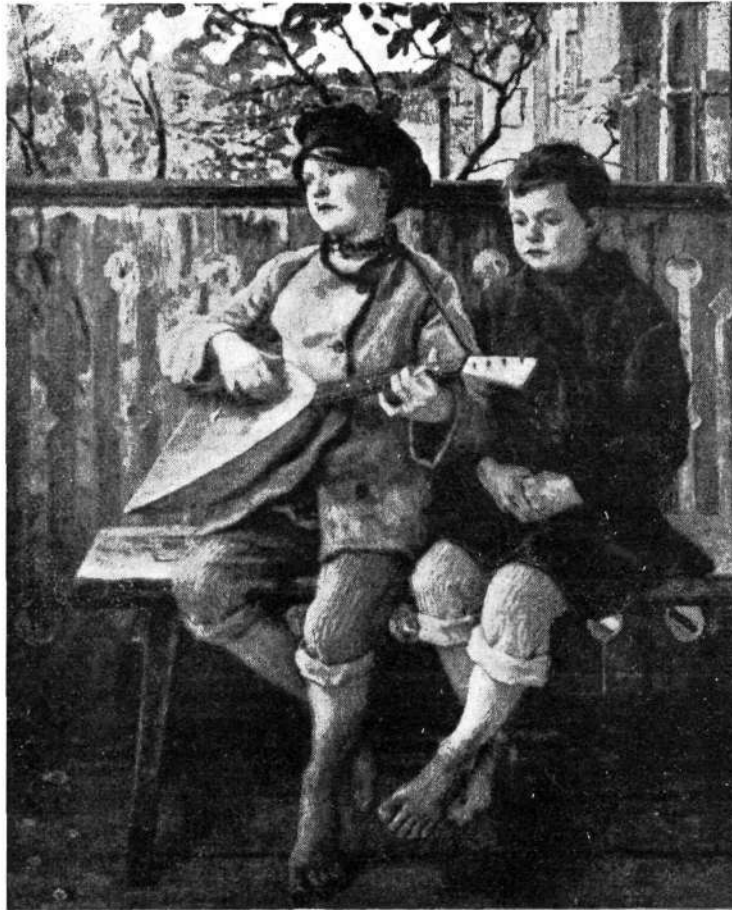
Н. П. Богдановъ-Бѣльскій.

Возвращаюсь я во второмъ часу ночи. На улицахъ ни души, вѣтеръ перемѣнился, усилился и пахнетъ моремъ, въ лицо мнѣ иногда