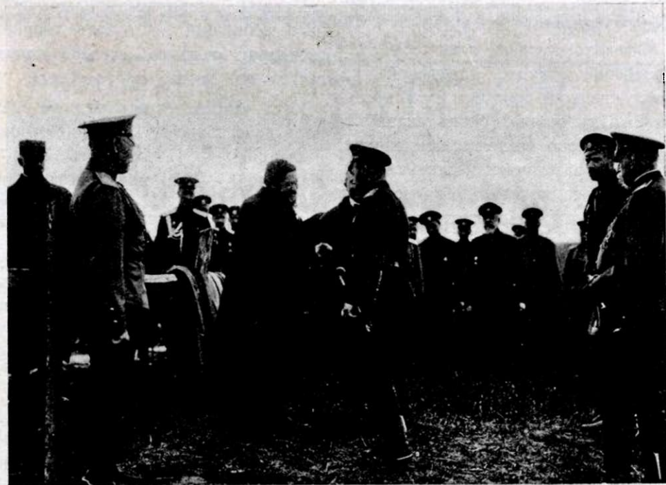
Французскіе делегаты Альбертъ Тома и Вивіани въ ставкѣ. Государь пожимаетъ руку Альберту Тома. Направо отъ него Вивіани, направо — ген. Алексѣевъ.