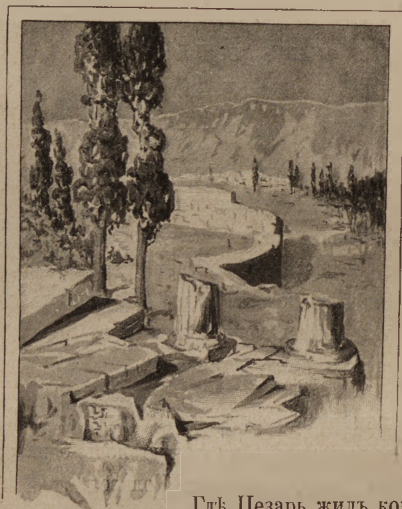
Гдѣ Цезарь жилъ когда-то